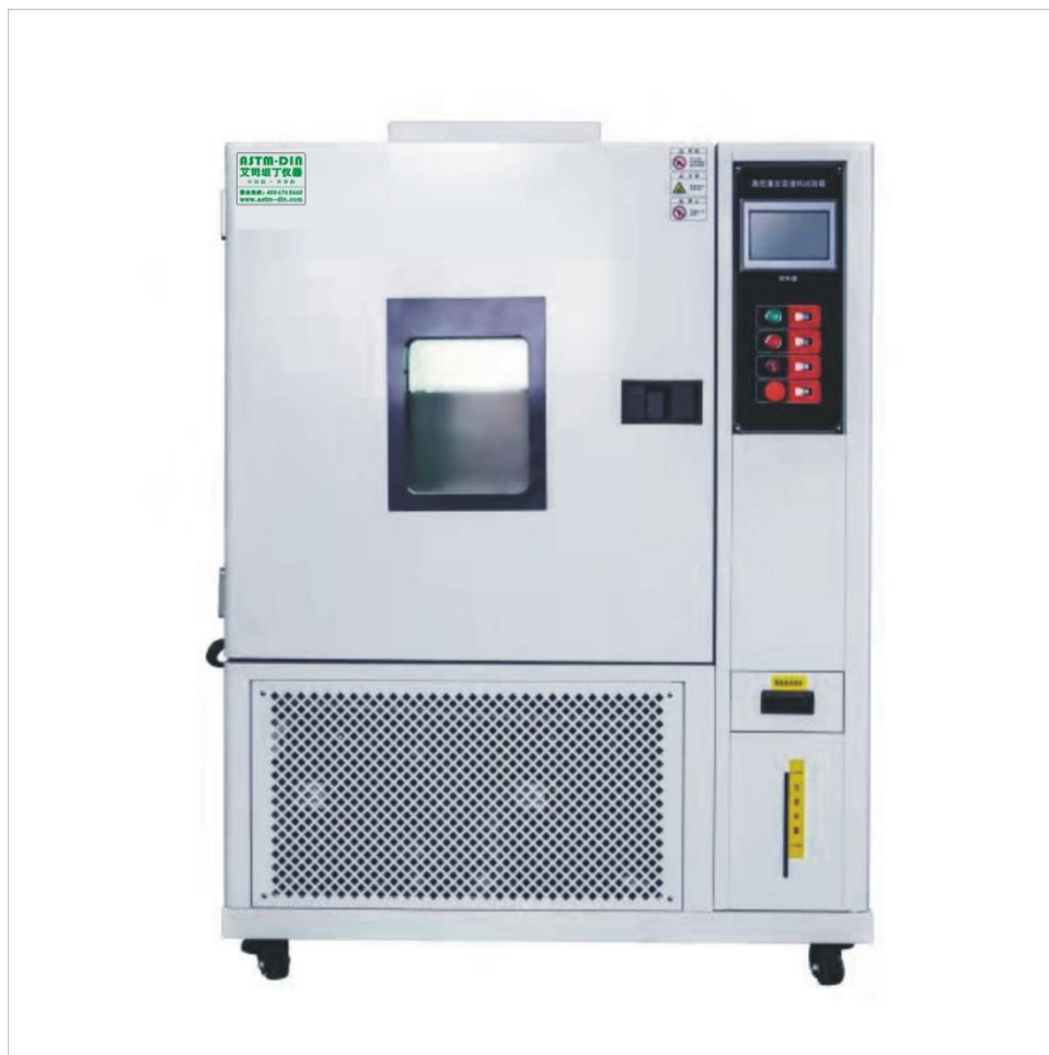
图片仅供参考，请以实物为准。